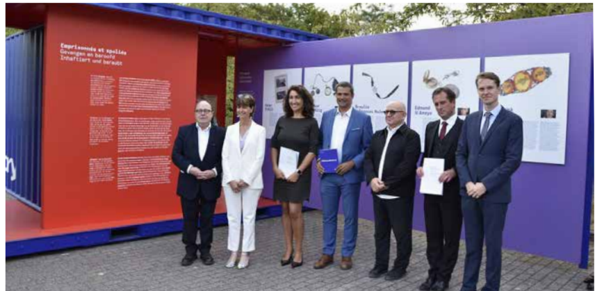
Waals minister Christie Morreale bezoekt de tentoonstelling aan het Rijksarchief in Luik @asbl Celida