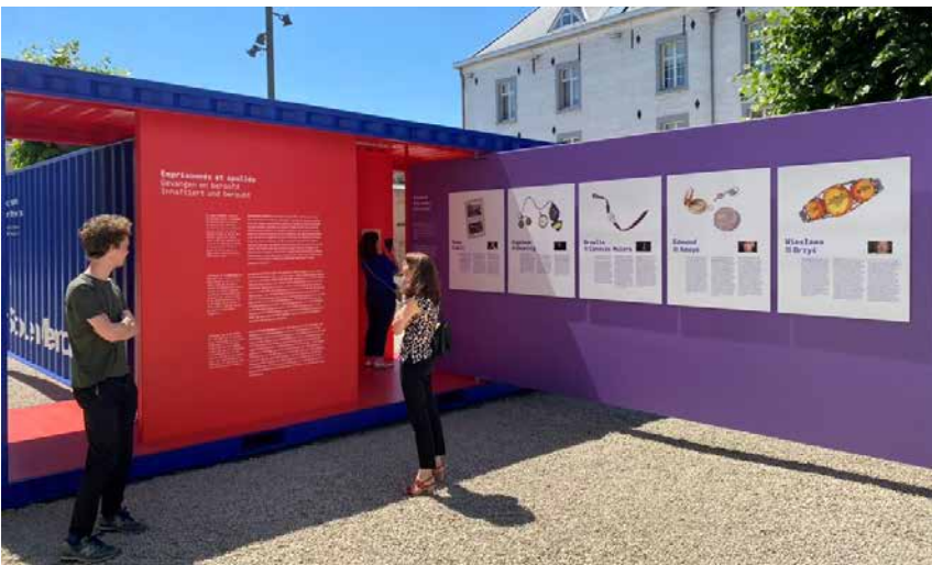
#StolenMemory in Eupen @Stadt Eupen