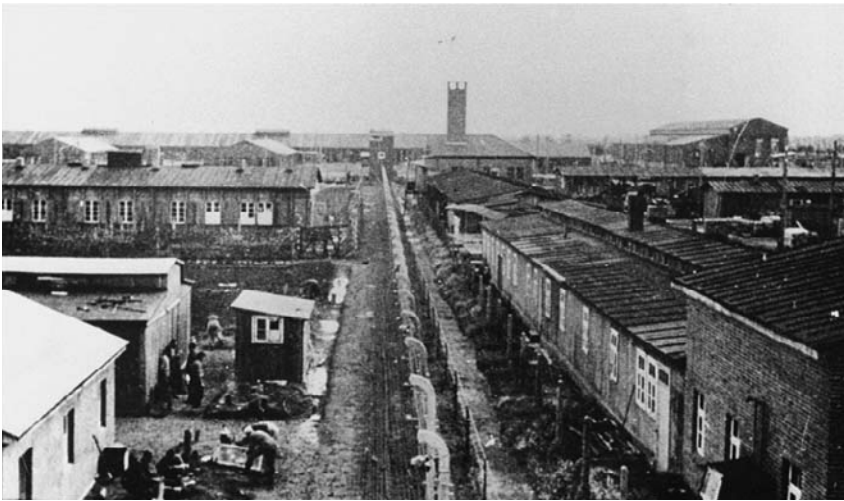
Het concentratiekamp van Neuengamme