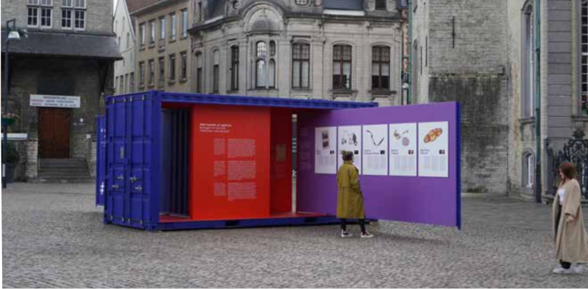
Grote Markt, Lier