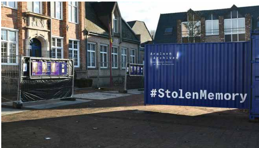
Egmontpaleis, Brussel @FOD Buitenlandse Zaken. Het Belgische luik van #StolenMemory kwam tot stand met steun van het Ministerie van Buitenlandse Zaken. Tot medio 2022 was België voorzitter van de Internationale Commissie die de Arolsen Archives beheert.