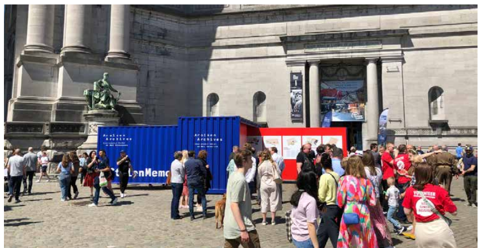
Egmontpaleis, Brussel. Het Belgische luik van #StolenMemory kwam tot stand met steun van het Ministerie van Buitenlandse Zaken. Tot medio 2022 was België voorzitter van de Internationale Commissie die de Arolsen Archives beheert.