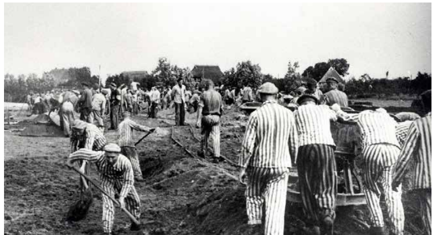
Het concentratiekamp van Neuengamme