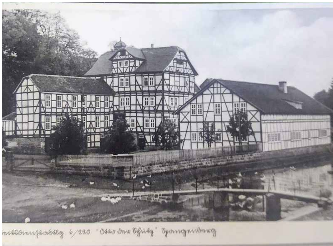
Krijgsgevangenenkamp Oflag IX A/H in Elbersdorf, nabij Kassel, waar Edmond Ameye 2 jaar in gevangenschap doorbracht. ©Archiv Spangenberg / POW sketch, D.S. Bertram, 1942, Imperial War Museum Collection Art.I WM ART LD 5199 D