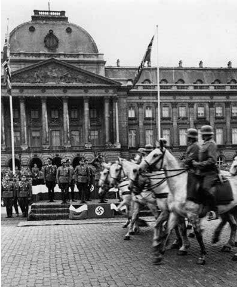
Parade van het Duitse leger voor het Koninklijk Paleis in Brussel