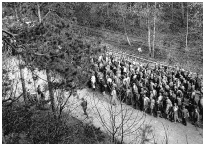
Dodenmars in de buurt van het concentratiekamp van Dachau.

God heeft hem bereid gevonden, omdat zijn leven gedurende langen tijd reeds een voortdurende voorbereiding was voor het laatste uur. (St. Ther.) Hetgeen de Heer heeft gewild is geschied. Gezegend weze de Naam des Heeren. (John.)