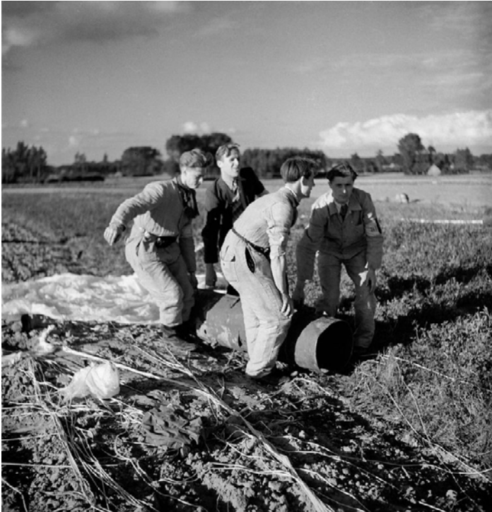
Gewapend verzet: Belgische verzetslieden verslepen een vat vol wapens en munitie dat werd gedropt door de geallieerden.