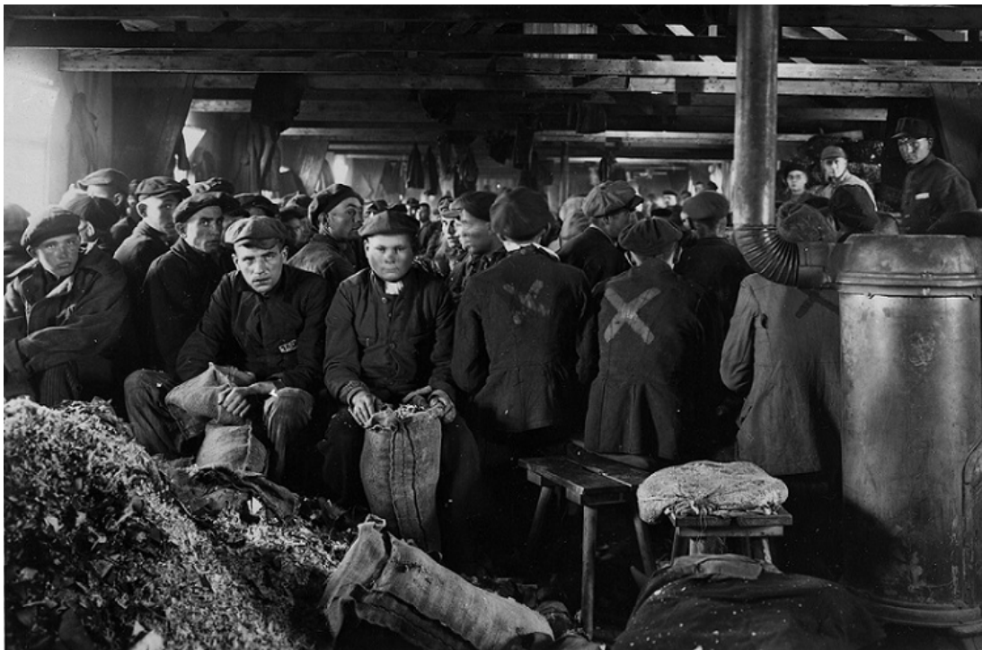
Dwargarbeiders in de Deutsche Ausruestungswerke (DAW), Neuengamme, Juni 1944. National Archives, WO 309/871