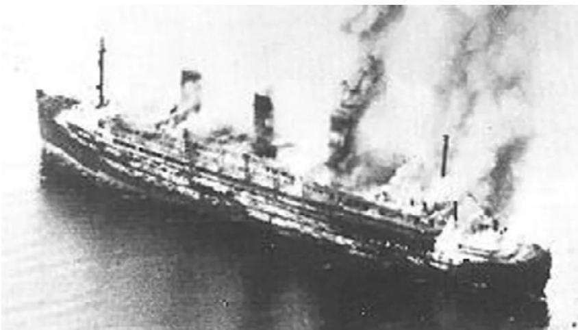
Het brandende passagiersschip SS Cap Arcona in de baai van Lübeck op 3 mei 1945. Bij het bombardement van de Cap Arcona en het vrachtschip Thielbeck kwamen meer dan 6000 concentratiekampgevangenen om het leven.