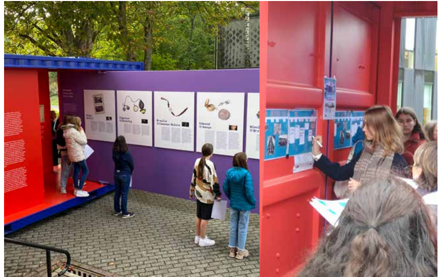
Schoolkinderen bezoeken de tentoonstelling in Gembloux en Sankt-Vith