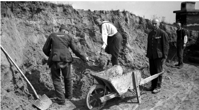
Dwargarbeit in het Kamp van Breendonk