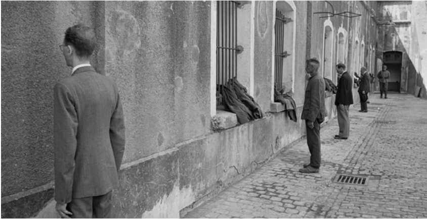
Gevangenen die zijn aangekomen in de 'Hel van Breendonk' moeten stilstaan tijdens de registratie en het uitdelen van de kampkledij; wie bewoog werd zwaar mishandeld, 13 juni 1941.