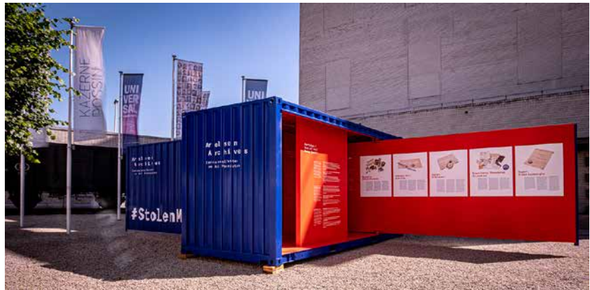
Kazerne Dossin, Mechelen