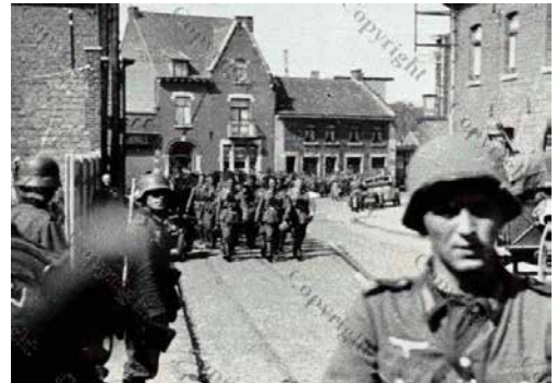
De Wehrmacht trekt Genk binnen tijdens Achttiendaagse Veldtocht, mei 1940 ©Cegesoma (CEGES CA 1/20/17/2 n° 2727).