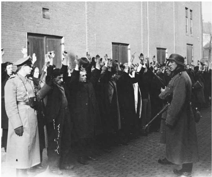
Genadeloze vervolging: op 22 en 23 februari 1941 worden zo'n 400 Joodse mannen willekeurig gearresteerd tijdens een grootscheepse actie in Amsterdam. De gevangenen worden gedeporteerd naar het concentratiekamp van Buchenwald en daarna naar Mauthausen. Ze werden bijna allemaal vermoord.