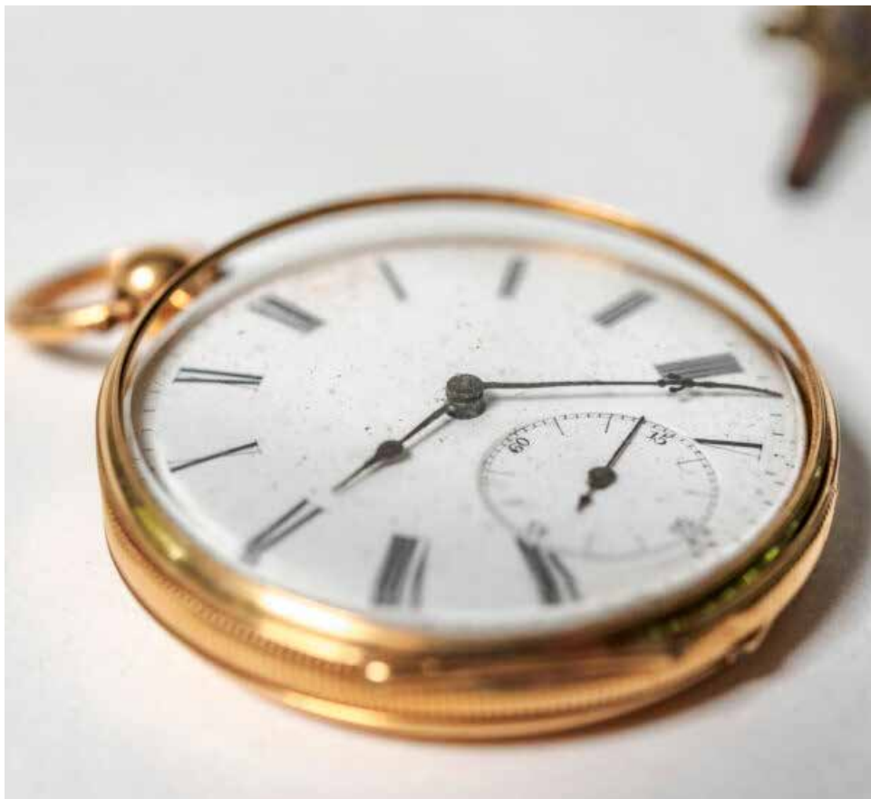
Het zakhorloge van Edmond Ameye, Arolsen Archives Collection