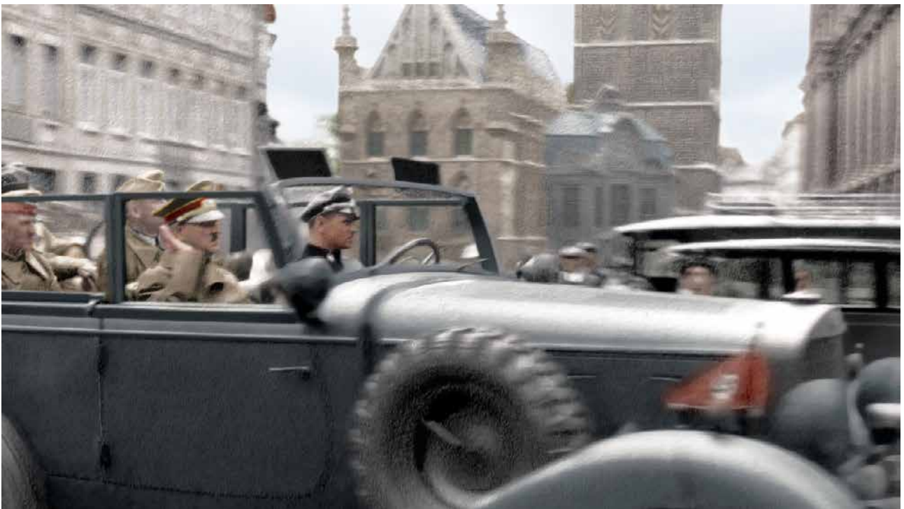
Adolf Hitler bezoekt de stad Gent in 1940 (het stadhuis is zichtbaar in de achtergrond). Met dank aan Sander van Wassenhove (beeld) en Korneel Bostyn (inkleuring).