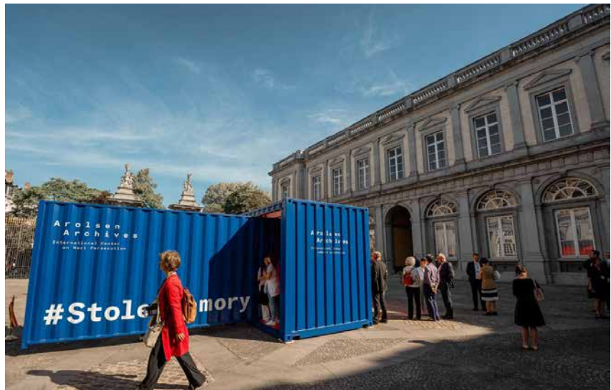
Egmontpaleis, Brussel