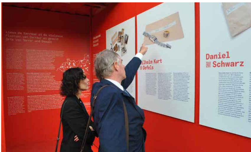
Minister van Buitenlandse Zaken, Hadja Lahbib, bezoekt de #StolenMemory-tentoonstelling in Breendonk @Arolsen Archives